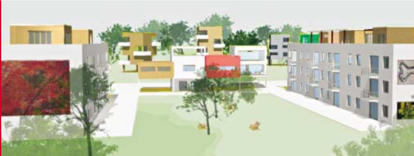
Eine ergänzende Nachverdichtung könnte dem Kanadaring neue Strukturen geben.