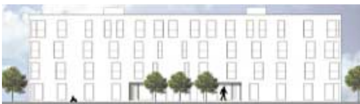
Die Achitektur der Eigentumswohnungen

Hochwertige Wohnungen in verschiedenen Größen, EG-Wohnungen mit großem Gartenanteil, schicke Penthouse-Wohnungen mit großzügiger Dachterrasse, in ruhiger und gehobener Lage, nur we-