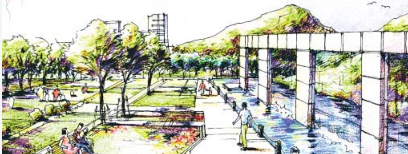
So könnte ein Schutterpark am Kanadaring aussehen