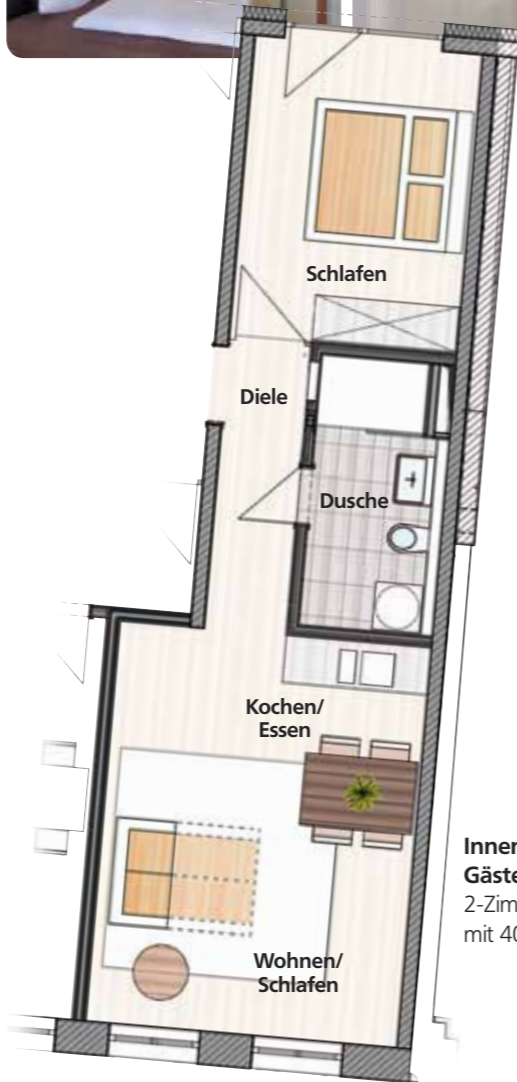
Innenstadt | Gästeappartement 2: 2-Zimmer-Whg. im 2. OG mit 40 m 2 Wohnfläche