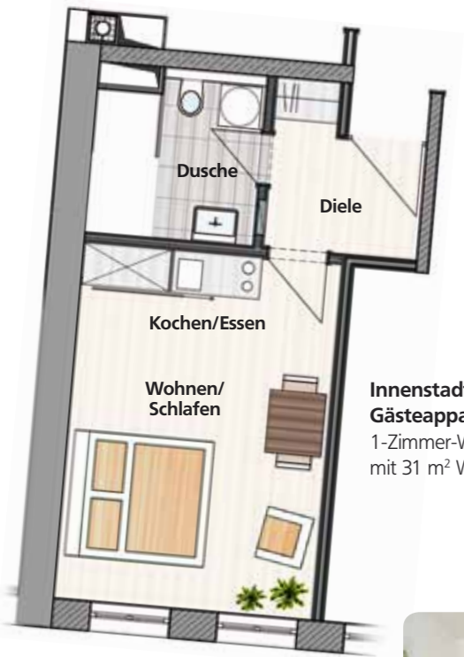
Innenstadt | Gästeappartement 1: 1-Zimmer-Whg. im 2. OG mit 31 m 2 Wohnfläche

Die maximale Reservierungsdauer beträgt 7 Tage.